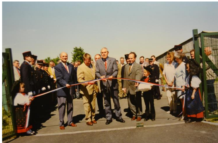
L'inauguration du club-house en 1997